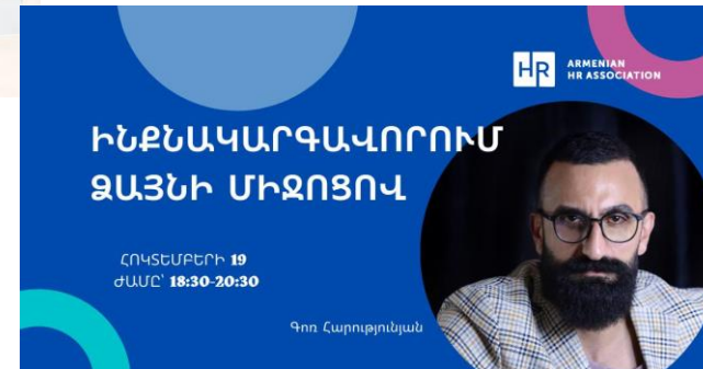
«Ինքնակարգավորում ՁԱՅՆԻ միջոցով»