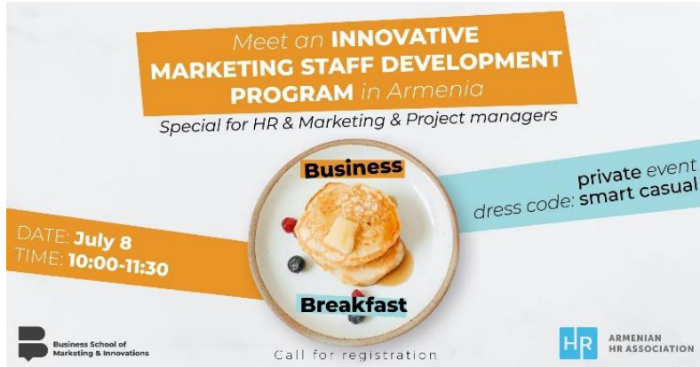
HR Breakfast with Marketing Menu