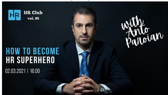
“How to become an HR SUPERHERO”