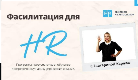
“Фасилитация для HR”