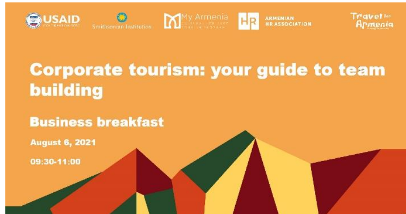
Corporate Tourism: Your Guide to Team Buildings