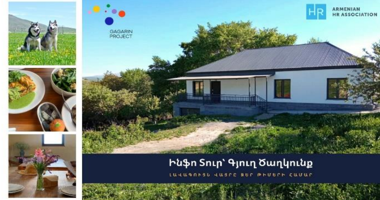
Info-tour at Tsaghkunk village